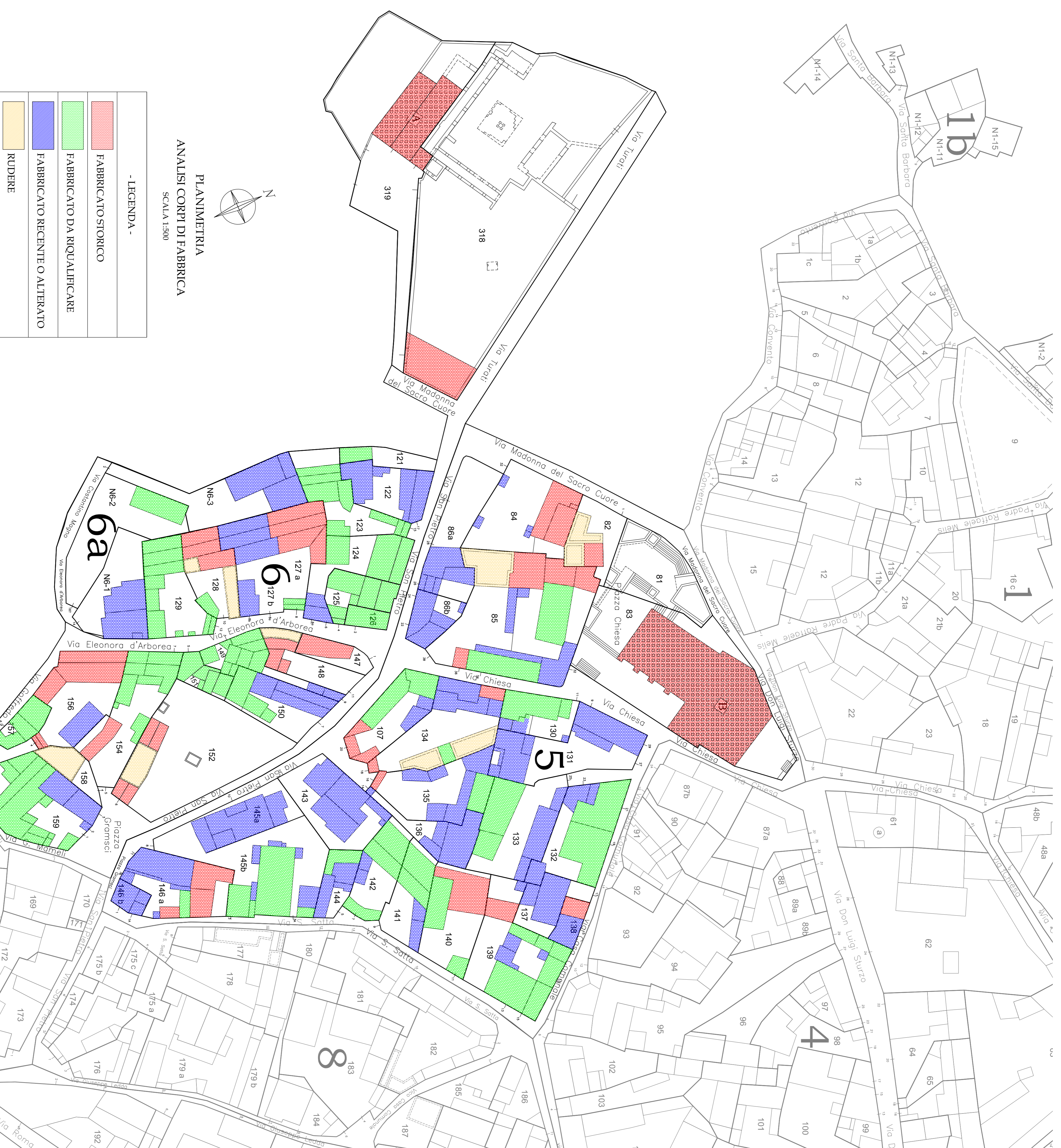
PLANIMETRIA ANALISI CORPI DI FABBRICA SCALA 1:500